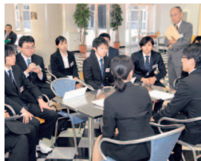
▲就職活動集中対策講座（3年次12月）