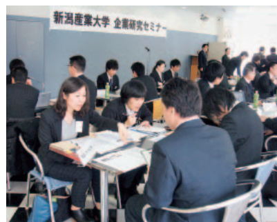
▲企業研究セミナー（3年次2月）

地元(福岡)に戻って不動産業界で活躍したいと考え、就職活動を始めました。週6日の水球部の練習や大会参加と並行して地元で就職活動することは困難の連続でした。新潟と福岡の移動距離や交通費を考えると、いかに効率的に地元の就職情報を入手し、合同説明会に参加し、選考の日程を組み立てるかに苦慮しました。「忙しいことを言い訳にしない」と決めて臨んだ就職活動ですが、企業側の採用担当者の方々や水球部の監督やチームメイトに日程調整の「お願い」をすることが多く、随分悩んだこともありました。しかし、結果として第一志望