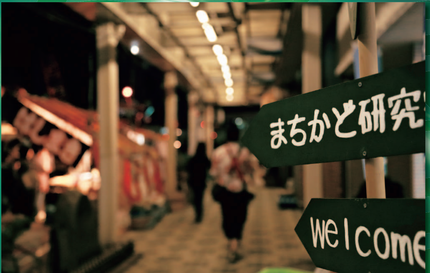
「まちかど研究室のえんま市」(写真の説明は裏表紙)