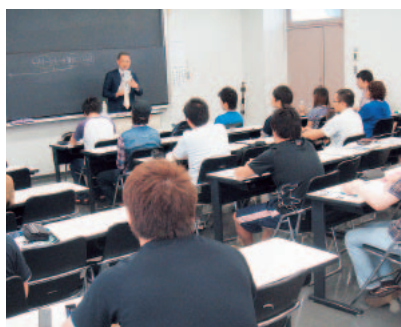
▲一般常識模試（3年次6月）

「人と話すことが苦手」「数字を扱うことが嫌い」など、人はだれでも「不得手なこと」があります。しかし、企業は社員の「苦手なこと」を考慮してはくれません。むしろ、それを克服しようとする努力に対して評価をするものです。