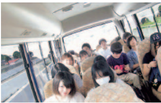
バスの中でクイズ大会を行いました