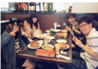
おいしいランチを食べました