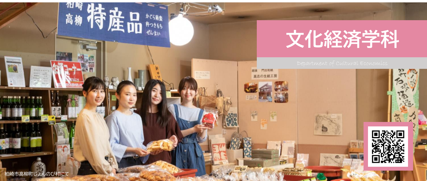
相高柳町じよんのび村にて