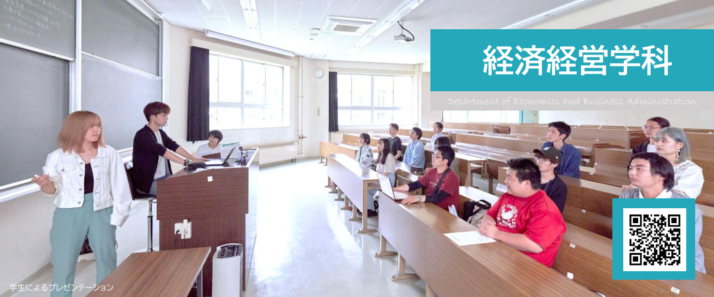
学生によるプレゼンテーション